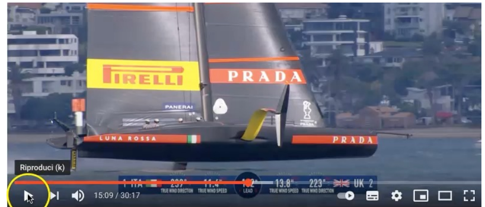
Luna Rossa in Coppa America