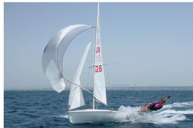
420 in andatura di lasco stretto con spinnaker e prodire al trapezio